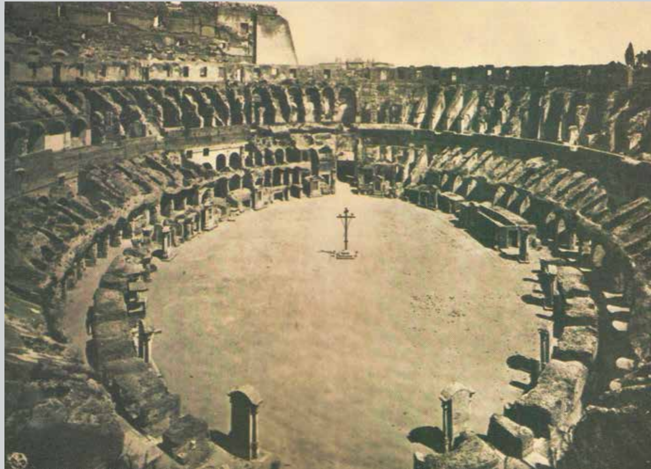
Colosseo, le edicole della Via Crucis voluta da Benedetto XIV nel 1719 all'interno dell'arena.