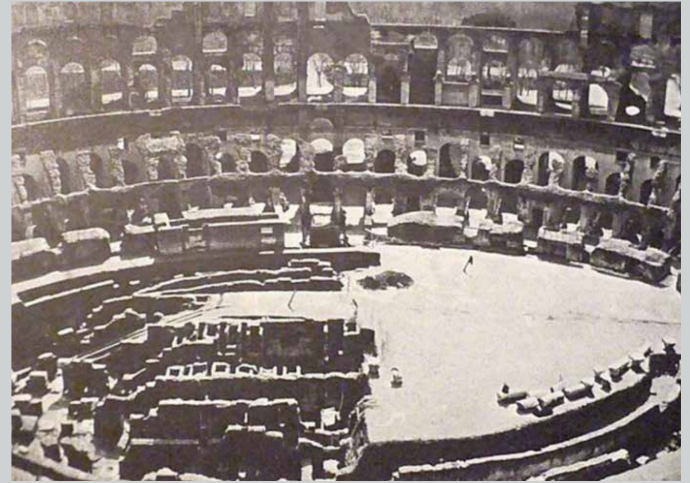
Il Colosseo durante la campagna di scavi del 1874-75 durante la quale furono messe in vista le strutture ipogee dell'arena.

preventive restoration, or rather mere conservation, safeguarding the statu quo , and represents a recognition that excludes the possibility of other direct intervention that is nothing more than conservative supervision and the consolidation of the matter ". We will therefore see how the statements by Minister Dario Franceschini, expressed in the press conference of 2 May 2021, devoid of any critical consideration, appear quite apart from any ideas of preservation. He stated that the project for the new arena will take "a